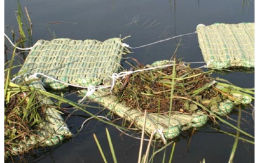
Abb. 4: Neuartige Brutflöße aus Textilmatten (REPOTEX).

Fig. 3: „Conventional“ nesting raft consisting of sheets of plastic with floats.