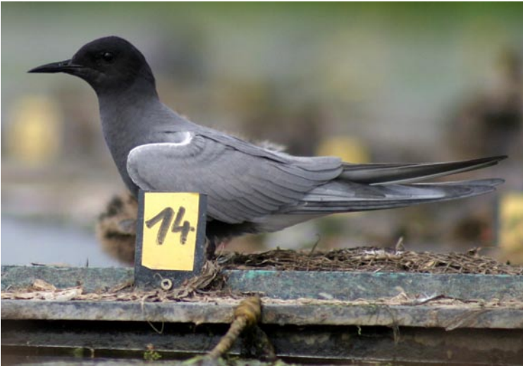
Abb. 1: Trauerseeschwalbe auf einem „herkömmlichen“ Brutfloß.

Fig. 1: Black Tern on a „conventional“ nesting raft.