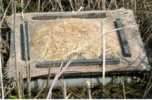
Abb. 3: Herkömmliches Brutfloß aus Kunststoffplatten mit Auftriebskörpern.

Fig. 3: „Conventional“ nesting raft consisting of sheets of plastic with floats.