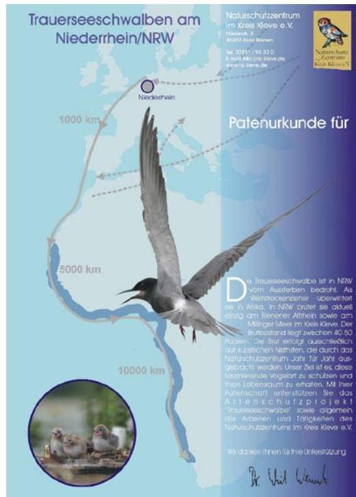
Abb. 7: Patenschaftsurkunde für das Artenschutzprojekt Trauerseeschwalbe.

Achim Vossmeier, Naturschutzzentrum im Kreis Kleve e.V., Niederstr. 3, 46459 Rees-Bienen; vossmeier@nz-kleve.de