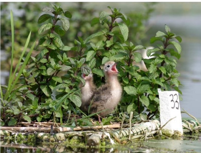
Abb.5: Trauerseeschwalben-Küken auf einem Nistfloß aus Textilmatten, bewachsen mit Kalmus ( Acorus calamus ) und Wasserminze ( Mentha aquatica ) etwa 6 Wochen nach der Bepflanzung.

doppelt so oft besetzt wie die gleichzeitig angebotenen „herkömmlichen“ Flöße aus Kunststoffplatten. Im Verlauf der Saison war dann zu beobachten, dass die Küken bzw. Jungvögel oft die vegetationslosen „herkömmlichen“ Flöße aufsuchten, da sie dort vermutlich besser von den Alttieren angefliegen und gefüttert werden können (Abb. 6 & 8). Gleichzeitig war festzustellen, dass sich die Küken an besonders heißen Tagen auf die Textilmattenflöße zurückzogen, um zwischen den Pflanzen Schutz vor der Hitze zu suchen. Eine Kombination beider Floßtypen könnte also in Zukunft von Vorteil sein.