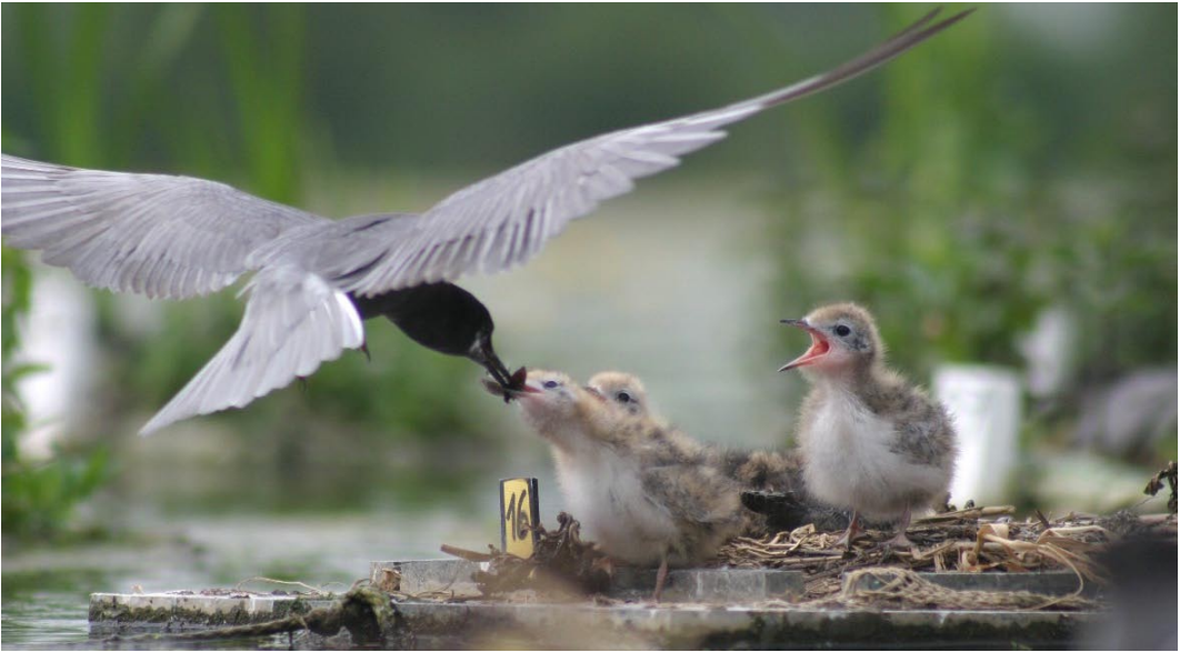
Abb. 6: Fütterung junger Trauerseeschwalben mit einem Käfer auf einem „herkömmlichen“ Floß.