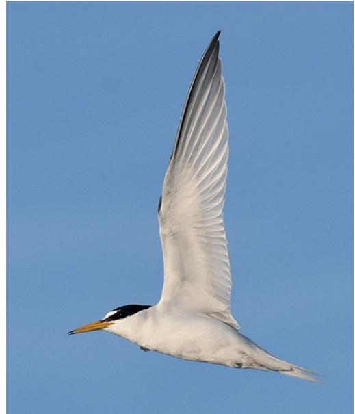
Zwergseeschwalbe im Prachtkleid am 21. Mai 2017, Laboe (Schleswig-Holstein). – Little Tern .

Die Anzahl der Beobachtungsorte wurde zusammengefasst und ergibt nach Räumen sortiert folgendes Bild: